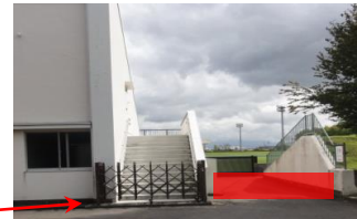
メインスタンド/メインスタンド側 (芝生席) 入場ゲート